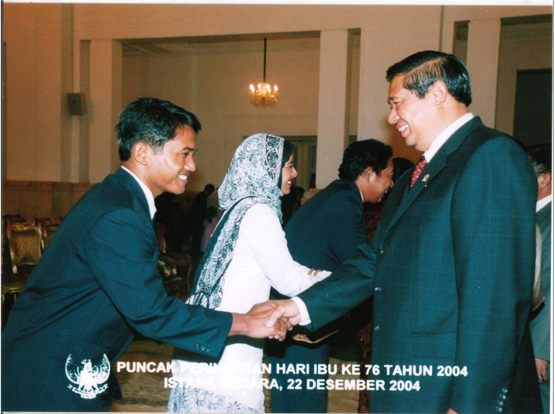
PUNCAK PERINGATAN HARI IBU KE 76 TAHUN 2004 ISTANA NEGARA, 22 DESEMBER 2004