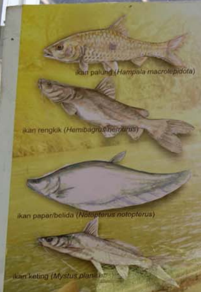
ikan palung ( Hampala macrolepidota )